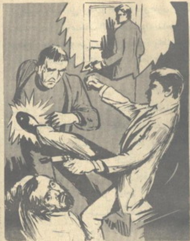
ثم ركل الثاني في بطنه بقوة ، واستدار مُطلقاً رصاصة واحدة من المسدس المزود بكاتم الصوت الذى يحمله ..